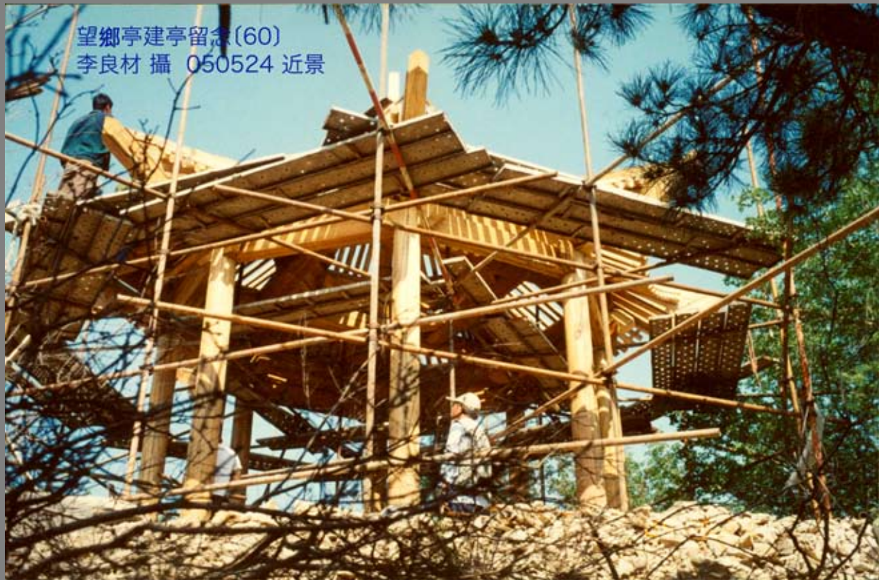
望鄉亭建亭留念(60) 050524 近景