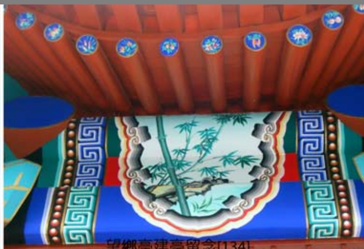
20050805 望鄉亭外側圖3