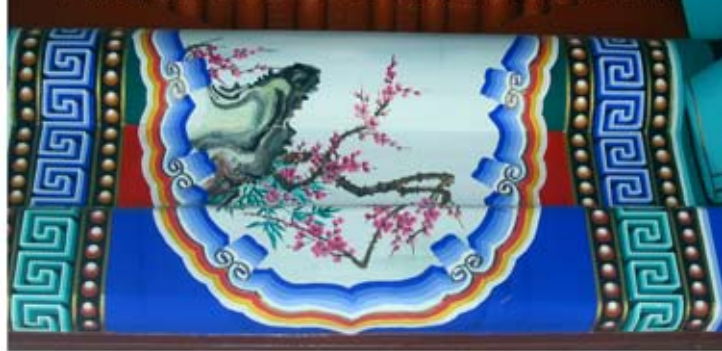
望鄉亭建亭留念[128]20050805 望鄉亭內側圖5 梅花