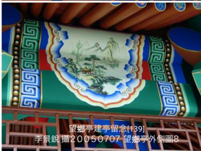
望鄉亭建亭留念[139] 20050707 望鄉亭外側圖8