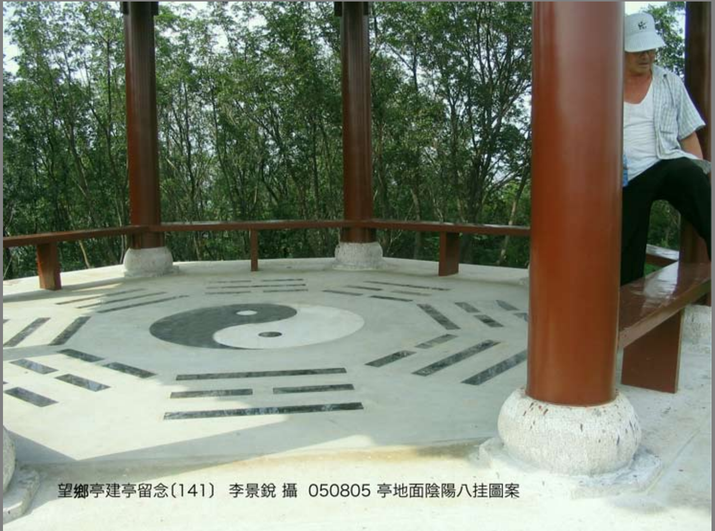
望鄉亭建亭留念(141) 050805 亭地面陰陽八掛圖案