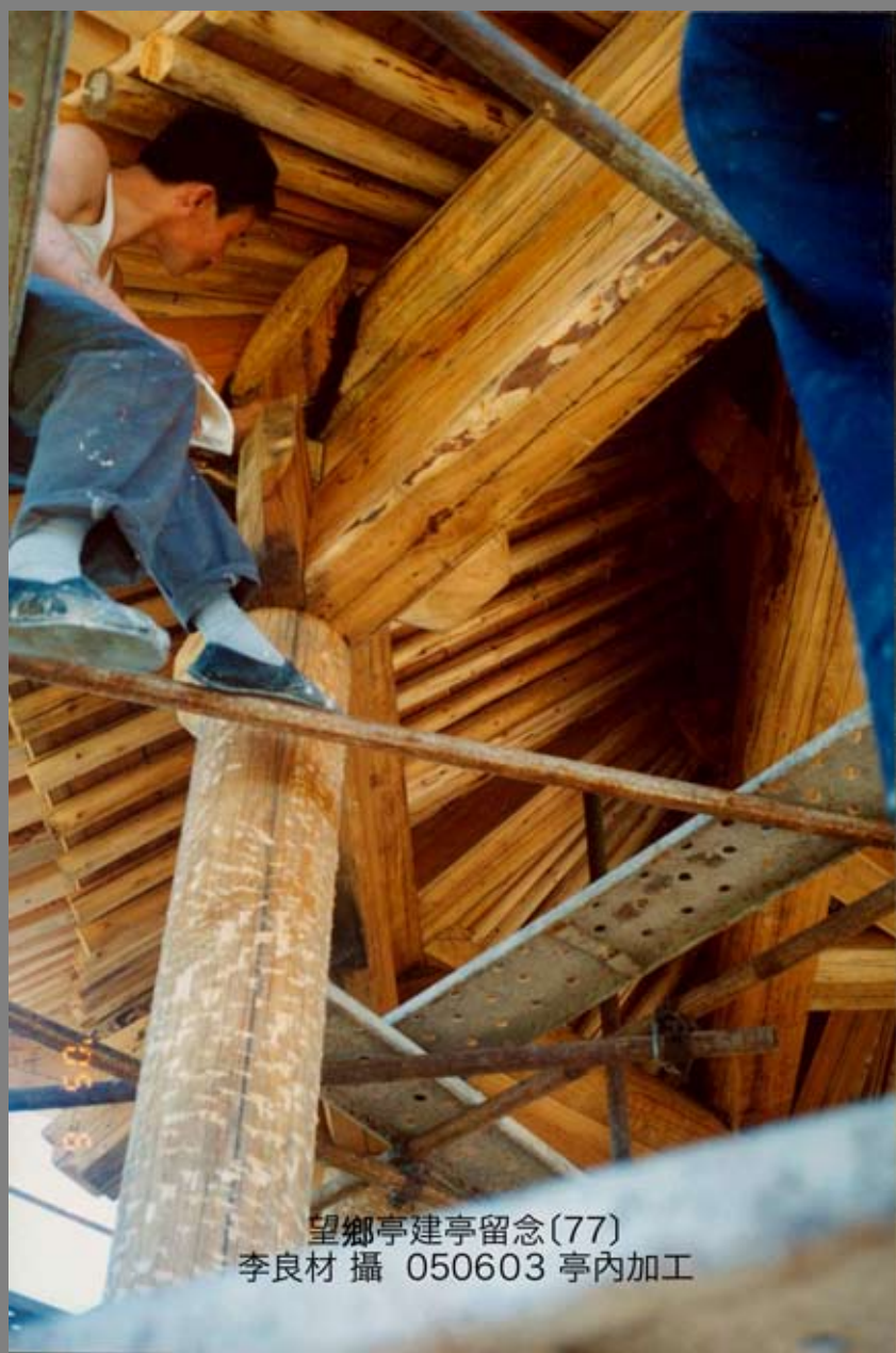
望鄉亭建亭留念(77) 050603 亭內加工