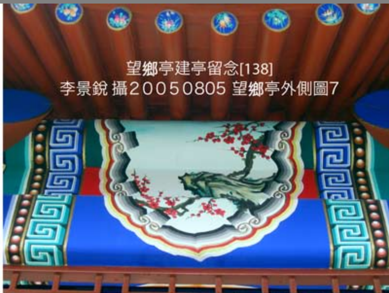
望鄉亭建亭留念[138]20050805 望鄉亭外側圖7