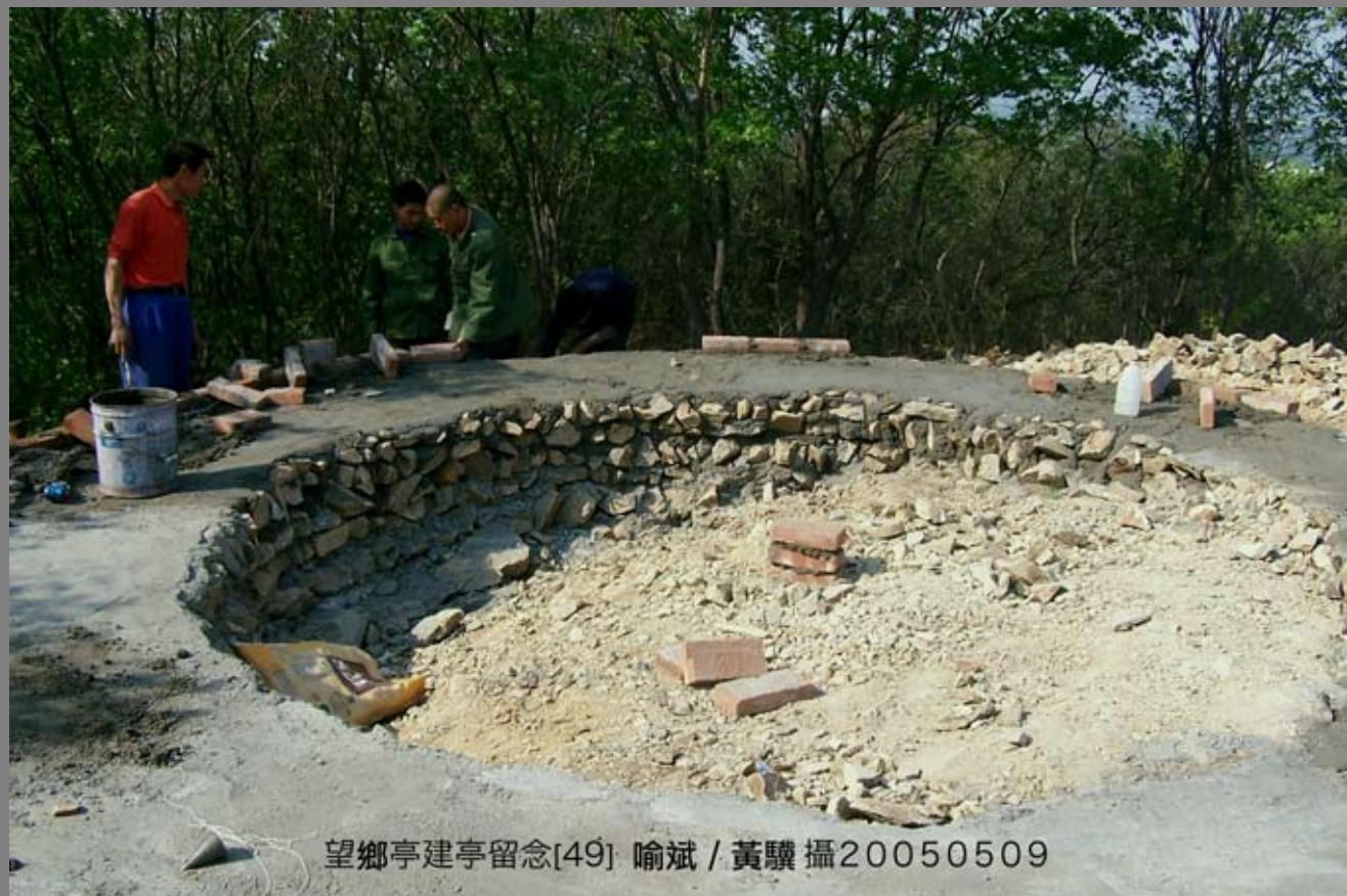
望鄉亭建亭留念[49] 喻斌 / 黃驥 攝20050509