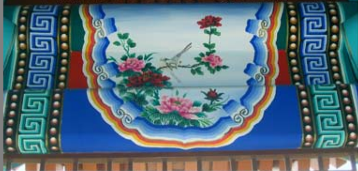
望鄉亭建亭留念[124]20050805 望鄉亭內側圖1 牡丹