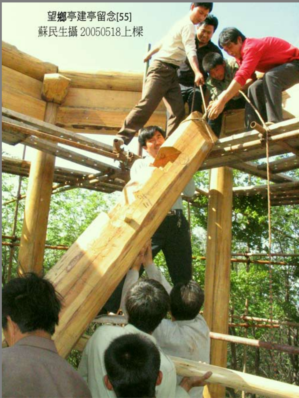
望鄉亭建亭留念[55] 20050518上樑