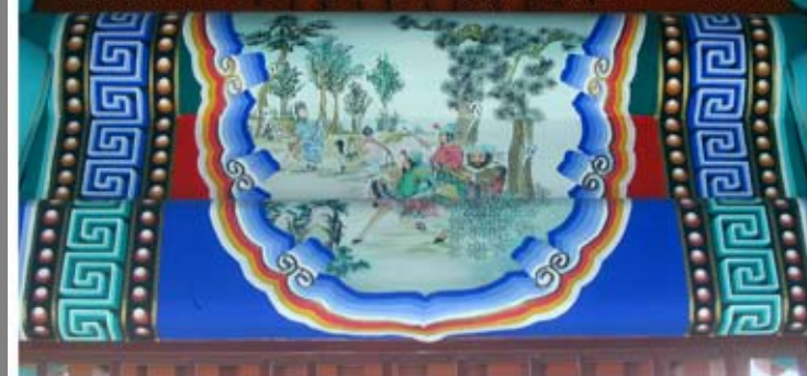
望鄉亭建亭留念[126]20050805 望鄉亭內側圖3 三顧茅廬