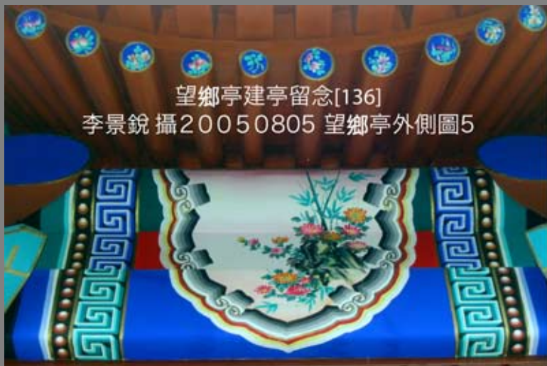
望鄉亭建亭留念[136]20050805 望鄉亭外側圖5