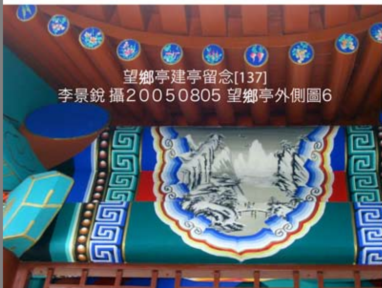
望鄉亭建亭留念[137]20050805 望鄉亭外側圖6