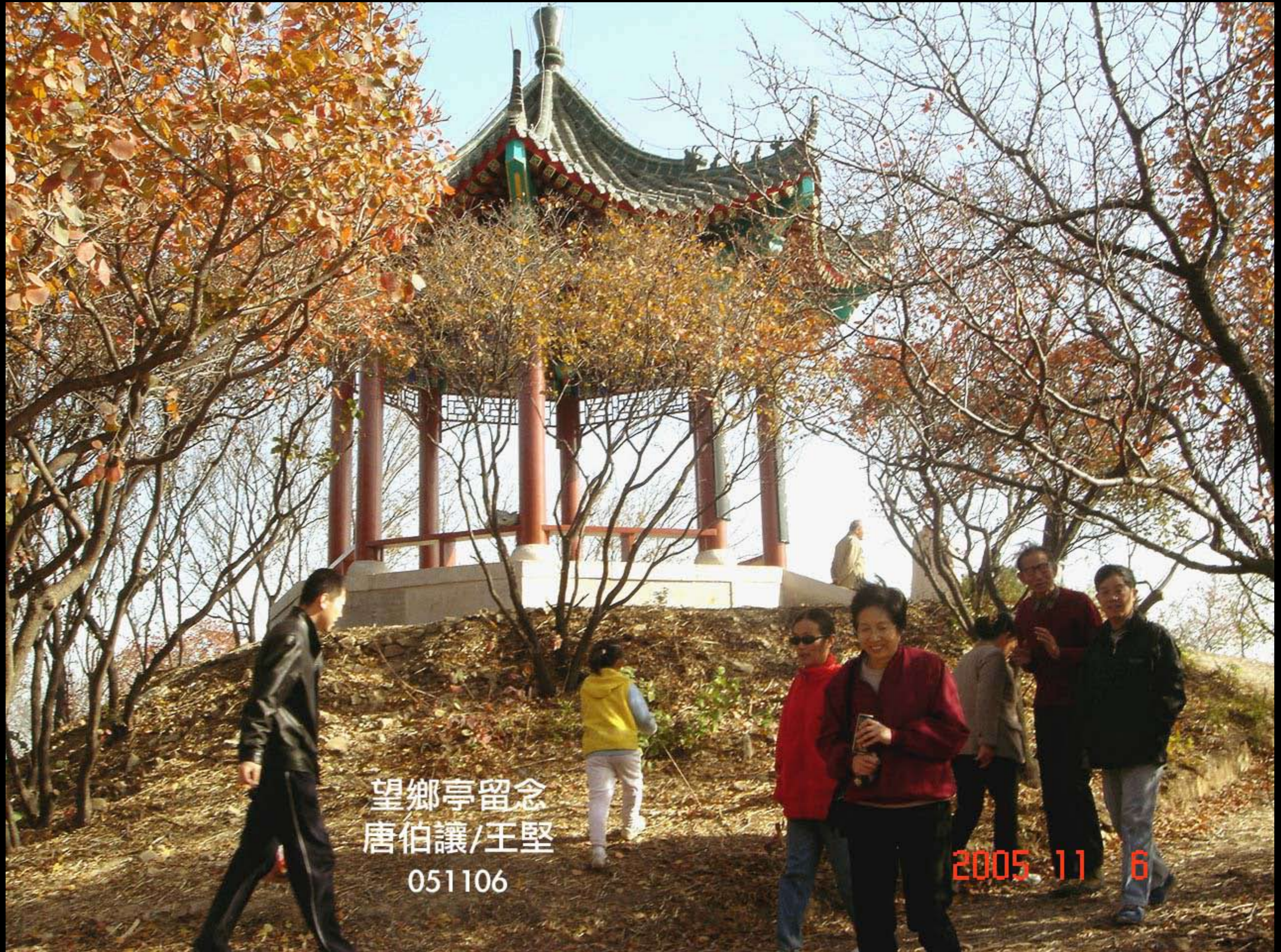
望鄉亭留念 唐伯讓/王堅 051106