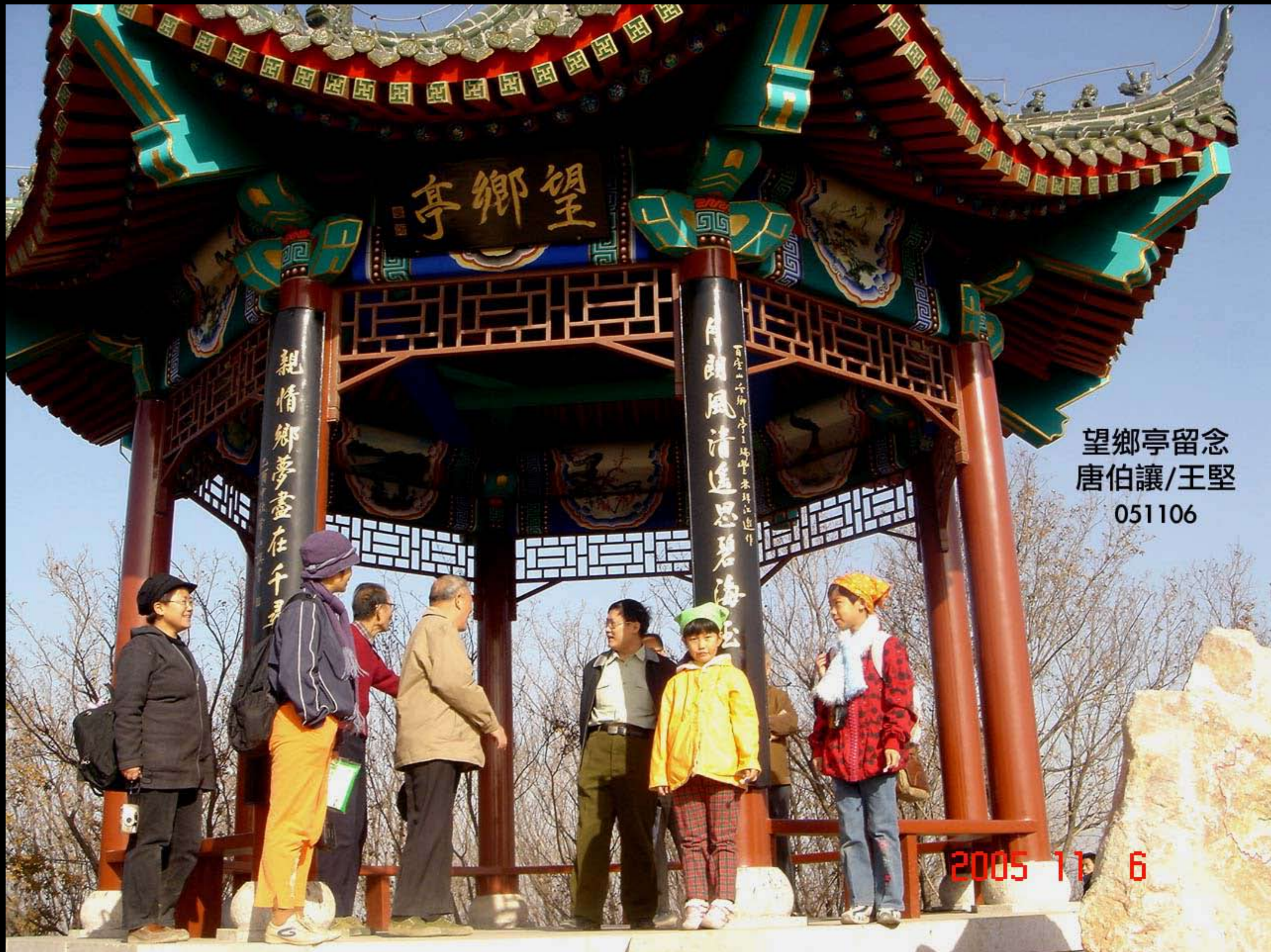
望鄉亭留念 唐伯讓/王堅 051106